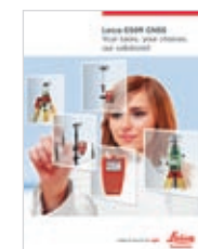
Leica G509 Produktbroschüre