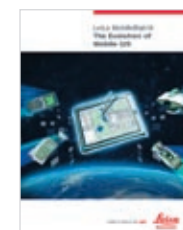
Leica MobileMatrix Produktbroschüre