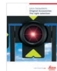
Leica Zubehör Produktbroschüre