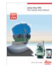
Leica Viva TP5 Produktbroschüre

Bluetooth® Warenzeichen und Logo sind Eigentum von Bluetooth SIG, Inc. und werden von der Leica Geosystems AG gemäss Lizenzvereinbarung genutzt. Weitere Warenzeichen und Bezeichnungen gehören den entsprechenden Eigentümern.