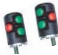
Multisticks Bedienung des Systems direkt von den Hydraulikhebeln ohne umständliches Umgreifen.