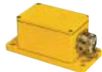
Querneigungssensor Ermittelt die aktuelle Querneigung der Schar für die exakte Neigungsregelung.