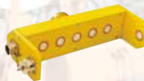
Sonic-Ski Höhensensor Durch die Verwendung von 6 Schwingern der genaueste berührungslose Ultraschallsensor.