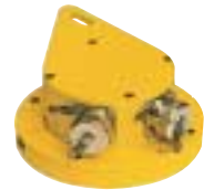
Drehkompensator Genauere Erfassung der Schar Drehung sorgt für optimale Kompensation der Querneigung.